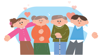
Sunglak Welfare Community Center

참여 어르신들께서는 '행복했다.', '내년에도 참여하고 싶다.' 등과 같이 참여 소감을 적극적으로 표현해 주셨습니다. 10회기 동안 열심히 참여해 주신 어르신들과 프로그램 준비로 애써주신 선생님들께 감사드립니다.