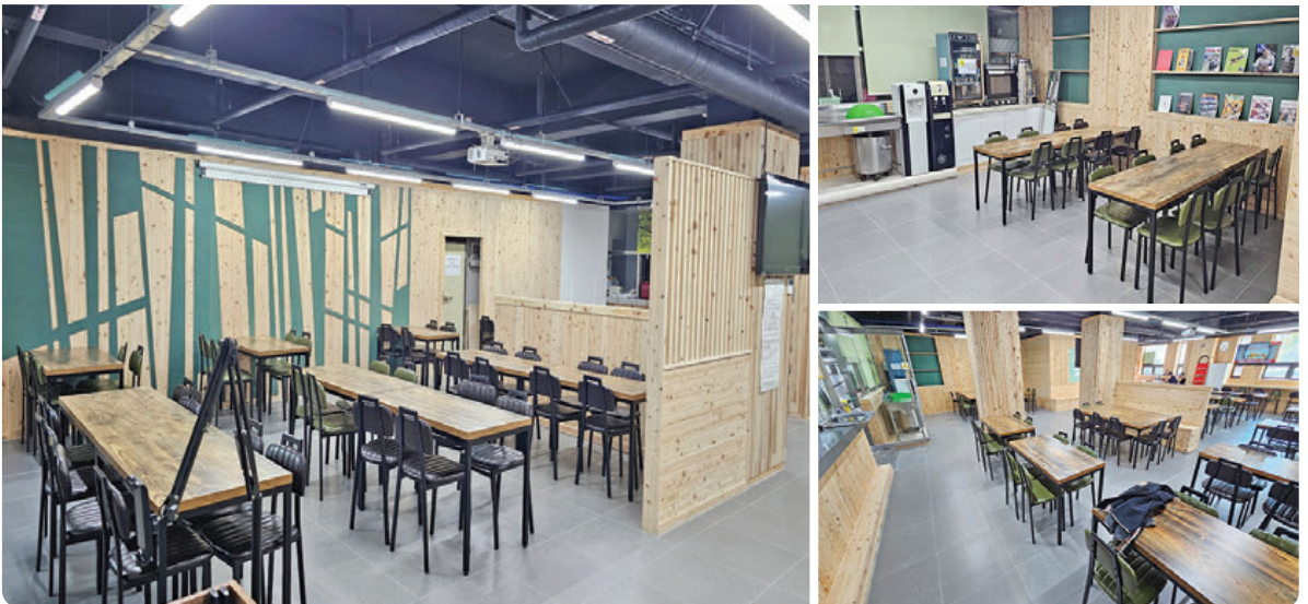
공사 후 달라진 모습

친환경 목재를 활용해 편백나무의 진한 향기가 나는 공간, '숲에서 만나ON'은 누구에게나 편안하게 이용할 수 있도록 열려 있으니 언제나 찾아와주세요~