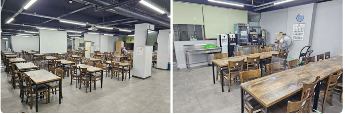
공사 전 모습

지난해 10월 복권기금지원으로 한국산림복지진흥원에서 주관하는 녹색자금 지원사업 실내 나눔숲 공모사업에 선정되어 올해 초 설계과정부터 함께 협업하면서 11월 초에 드디어 공사가 완공돼 1층 만나홀이 실내 나눔숲 '숲에서 만나ON'으로 탈바꿈되었습니다.