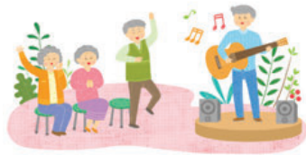
Sunglak Welfare Community Center